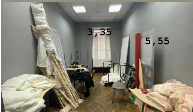
Кімната 1.1 (19.0)