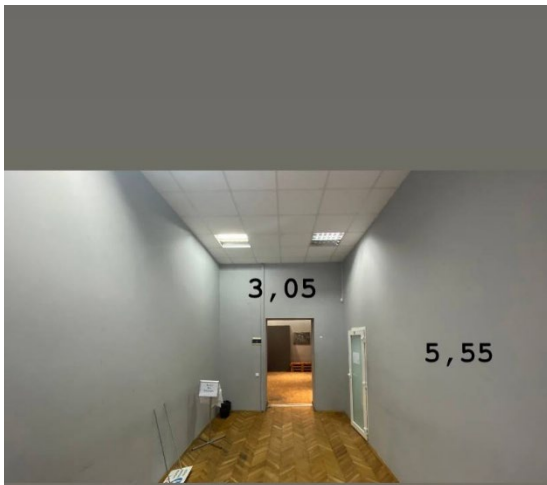
Кімната 1 (біля кабінету) 11.2